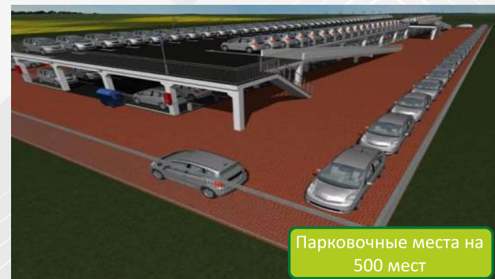
Парковочные места на 500 мест