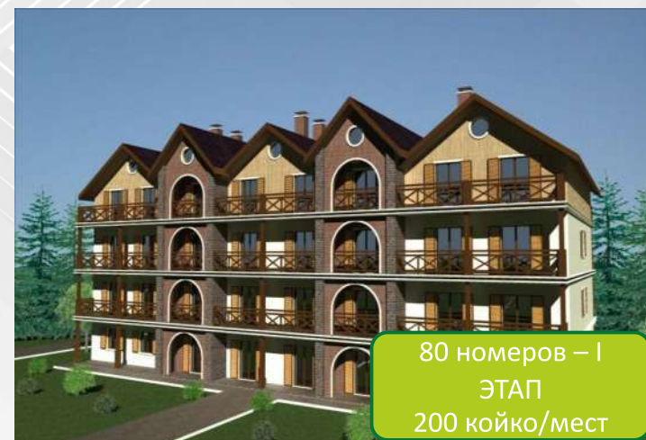
80 номеров – I ЭТАП 200 койко/мест